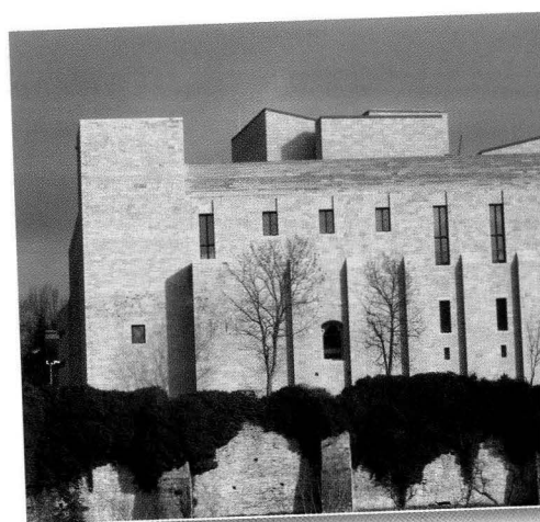
Sopra: l'antica facciata dell'Archivio Reale a Pamplona e aggiunta di Rafael Moneo. Articolo di Carlos Kasner

In copertina: realizzazioni di Thomas Herzog. Articolo di Fabrizio Tucci e Alessandra Battisti a pag. 548.